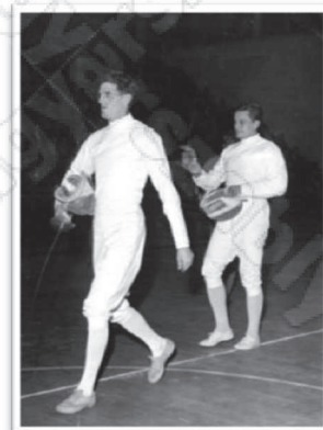
Kárpáti Rudolf és Gerevich Aladár

Négy olimpián hat aranyat szerzett, 1948-ban Londonban, 1952-ben Helsinkiben csapatban, 1956-ban Melbourne-ben és 1960-ban Rómában mind csapatban, mind egyéniben. Ez utóbbi különlegesség a sportág történetében, korábban erre csak egy másik magyar, dr. Fuchs Jenő volt képes (1908, 1912). A világbajnokságokon hétszer végzett az élen, ebből 1954-ben és 1959-ben egyéniben bizonyult a legjobbnak, ezen kívül